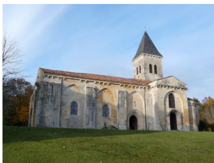
Abbatiale de Ligeux

Sources : Archives Départementales de l'Aude AC/91/GG11 - Archives Départementales de la Dordogne 5 E 317/9 - 5 E 317/29 - 5 E 461/12 - 5 E 550/11 - 5 E 550/12 - E DEP 5097 GG98 - E DEP 5098 GG100 - E DEP 5102 GG109.