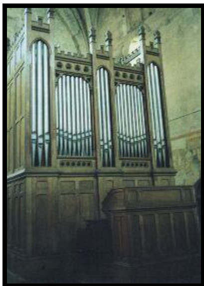
L'orgue Gabriel Cavallé-Coll de la collégiale de Saint-Emilion