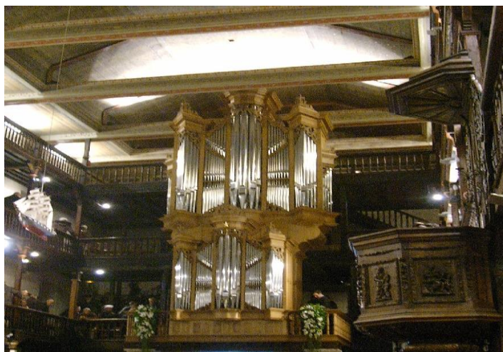
Avril 2014 : Orgue de Ciboure

Depuis 2001, A.D.OR.A. propose des sorties d'étude pour découvrir des orgues, le patrimoine historique et naturel de chaque région visitée. Ainsi, ont été visitées les orgues de Bordeaux (Ste Croix – St Augustin – St Ferdinand – Ste Marie – Temple du Hâ), St-Cyprien, Le Bugue, St Etienne de Baïgorry, Bazas, Lescar, Saintes, Rodez, Barsac, Preignac, St Savin en Lavedan, Nontron, St Bertrand de Comminges, Angoulême (cathédrale et St Jacques), Caen (St Etienne), Falaise, St Estèphe, Pauillac, Tours (cathédrale et temple), Hendaye (St Vincent), Urrugne, Carcassonne, Albi, Gimont, Monfort, Bagnères de Bigorre, La Rochelle (cathédrale et ND), Foix (St Volusien), Ciboure, Urt, Monein ainsi que le musée de l'harmonium à Bars (24).